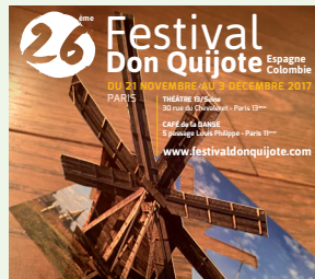
Festival Don Quijote